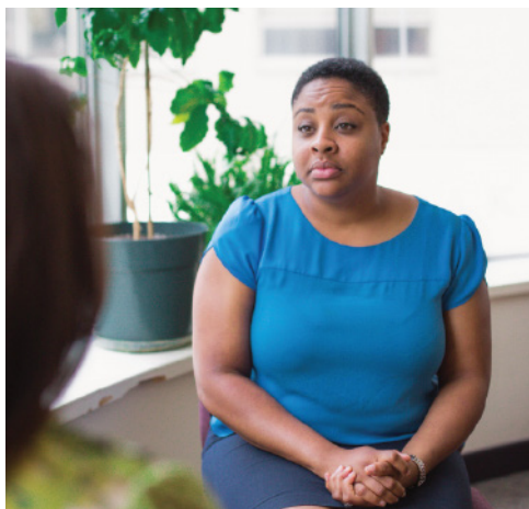
A torontói Catholic Family Services egy tanácsadója A counsellor at Catholic Family Services of Toronto